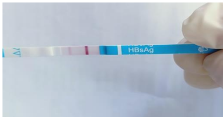
Hasil kontrol positif virus hepatitis

adanya virus hepatitis akan bekerja maksimal dan memberikan hasil yang pasti setelah 3 minggu setelah tikus terinfeksi virus. Jadi tahap yang belum terselesaikan adalah tahap perlakuan dengan pemberian air rebusan batang porbia dan melakukan melakukan kontrol dengan uji stick pada serum tikus setelah pengobatan dengan air rebusan dan antihepatitis (Enterferon).