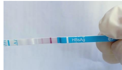
Hasil pada minggu ke-12 didapatkan 1 (satu) sampel positif