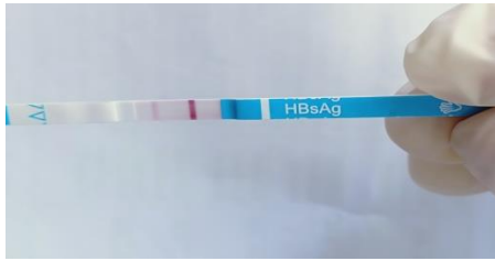
Hasil kontrol positif virus hepatitis

adanya virus hepatitis akan bekerja maksimal dan memberikan hasil yang pasti setelah 3 minggu setelah tikus terinfeksi virus. Jadi tahap yang belum terselesaikan adalah tahap perlakuan dengan pemberian air rebusan batang porbia dan melakukan melakukan kontrol dengan uji stick pada serum tikus setelah pengobatan dengan air rebusan dan antihepatitis (Enterferon).