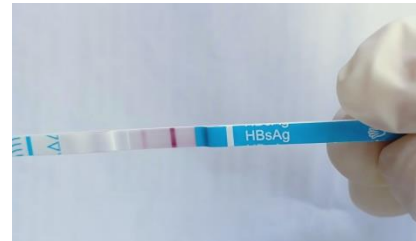
Hasil pada minggu ke-12 didapatkan 1 (satu) sampel positif