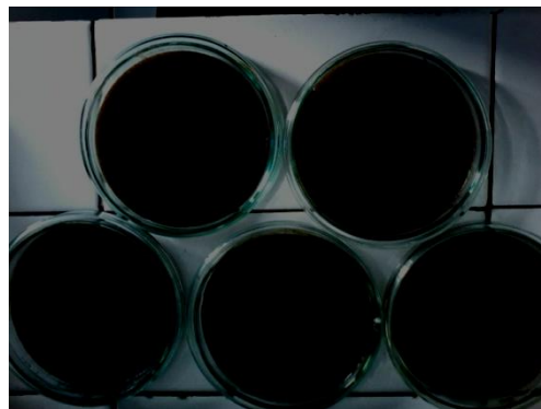
Gambar 1 Tekstur media formulasi bubuk bunga Cengkeh ( Syzygium aromaticum ) dalam media Teri Ubi Rumput Laut Medium (TURLM) Formula 3 dalam petridisk

Media Formula kombinasi Bubuk bunga CengkehTURLM 3 yaitu TURLM Formula 3 Kombinasi 1 dengan komposisi media : Tepung Ikan Teri Laut 50,1 gram, Tepung Ubi Jalar Ungu 45 gram, Tepung Rumput Laut 4,5 gram, Agar – Agar 15 gram, Gliserol 12 ml, Bubuk bunga Cengkeh 5 gram dan Aquadest 1000 ml. TURLM Formula 3 Kombinasi 2 dengan komposisi media : Tepung Ikan Teri Laut 50,1 gram, Tepung Ubi Jalar Ungu 45 gram, Tepung Rumput Laut 4,5 gram, Agar – Agar 15 gram, Gliserol 12 ml, Bubuk bunga Cengkeh 10 gram dan Aquadest 1000 ml. TURLM Formula 3 Kombinasi 3 dengan komposisi media : Tepung Ikan Teri Laut 50,1 gram, Tepung Ubi Jalar Ungu 45 gram, Tepung Rumput Laut 4,5 gram, Agar – Agar 15 gram, Gliserol 12 ml, Bubuk bunga Cengkeh 15 gram dan Aquadest 1000 ml. Masing – masing campuran formula di masukkan dalam beker glass di panaskan sampai mendidih, dimasukkan dalam tabung ulir sebanyak 7 ml, disteril 121 derajat Celsius selama 15 menit, medium dimiringkan sampai membeku, selanjutnya dilakukan uji stabilitas medium sebelum digunakan. Adapun deskripsi data dan gambaran tekstur dari media TURLM 3 tanpa dan dengan bubuk cengkeh, masing – masing formulasi media dapat dilihat pada tabel 1, gambar 1.